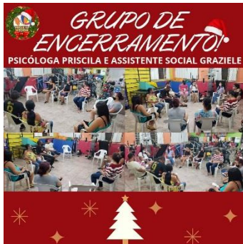
GRUPO DA PSICÓLOGA E ASSISTENTE SOCIAL, ENCERRAMENTO DO ANO (17/12)