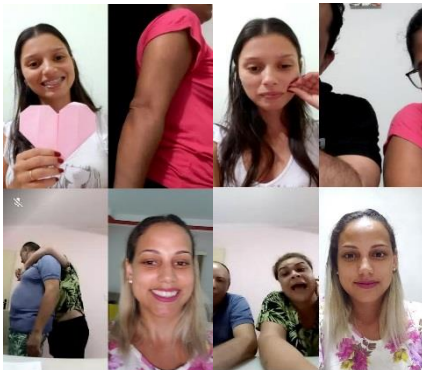
GRUPO DO CASAL