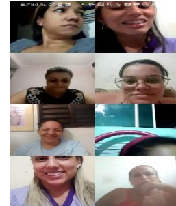
GRUPO DAS MÃES