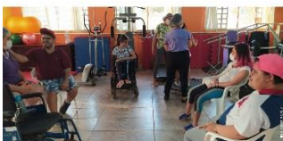
TERAPIA COM OS ATENDIDOS 10/09/2021