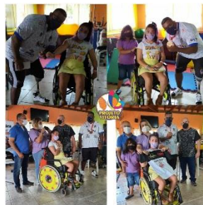
DOAÇÕES DE CESTAS BÁSICAS PELO ATLETA PARALÍMPICO THIAGO PAULINO