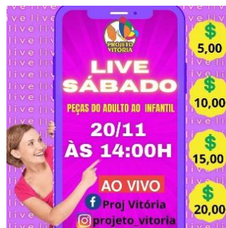
LIVE BENEFICENTE 20/11