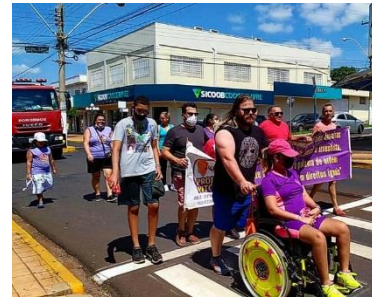
6ª CAMINHADA INCLUSIVA (04/12)