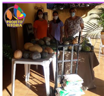
DOAÇÕES ABÓBORAS FUNDO SOCIAL