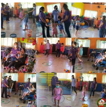
TERAPIA COM A EQUIPE MULTIDISCIPLINAR (10/12)