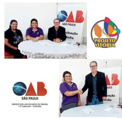
DOAÇÃO DE CHEQUE PARA FESTINHA DE NATAL DO PROJETO (17/12)