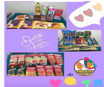
DOAÇÕES DE ALIMENTOS PRÉ-VESTIBULAR MARCOS BARROS