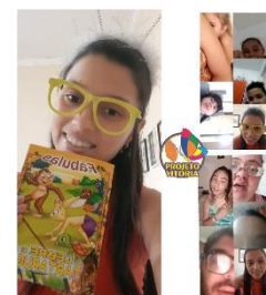
GRUPO DA PSICÓLOGA ONLINE COM OS ADOLESCENTES E CRIANÇAS 14/09