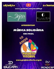
LIVE 10 ANOS- MÚSICA SOLIDÁRIA