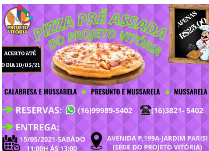
CAMPANHA DO MÊS