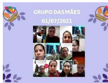
GRUPO DAS MÃES