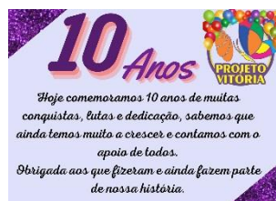
ANIVERSÁRIO 10 ANOS