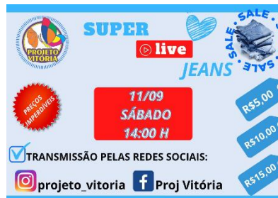
LIVE JEANS (11/09/2021)