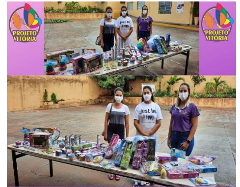
DOAÇÕES DE BRINQUEDOS DO FUNDO SOCIAL/UNIMED