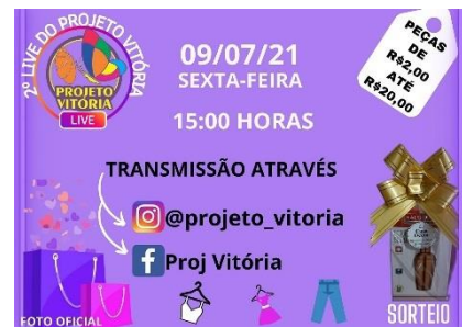
LIVE SOLIDÁRIA DE ROUPAS