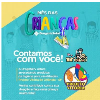
CAMPANHA DE ARRECAÇÃO DE PRODUTOS DE HIGIENE PELA DROGARIA TOTAL UNIDADE DROGASERV