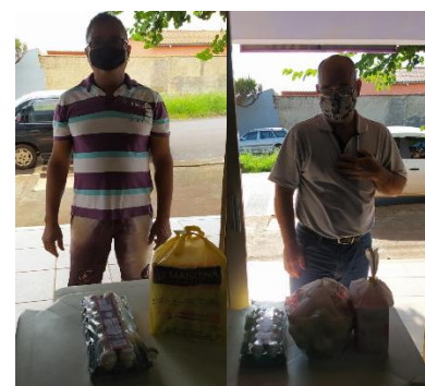
DOAÇÕES DE VERDURAS, OVOS E LEITE