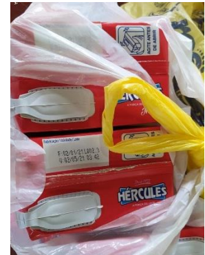
DOAÇÃO DE LITROS DE LEITES