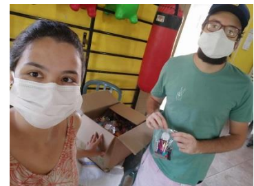
DOAÇÕES PARA A PÁSCOA