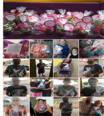
LEMBRANCINHA EM COMEMORAÇÃO AO DIA DAS MÃES