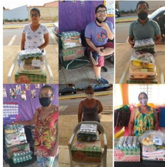
ENTREGA DE DOAÇÕES DE CESTAS BÁSICAS, OVOS, LEITES PARA AS FAMÍLIAS