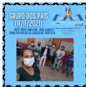
GRUPO DOS PAIS (11/11)