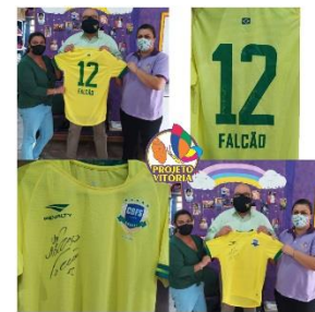
DOAÇÃO DE UMA CAMISETA DA SELEÇÃO BRASILEIRA