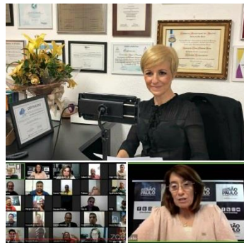
LANÇAMENTO DA CARTILHA DE COMBATE À VIOLÊNCIA DOMÉSTICA CONTRA A PESSOA COM DEFICIÊNCIA