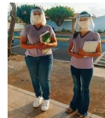
VISITA DOMICILIAR PELA ASSISTENTE SOCIAL E PSICÓLOGA