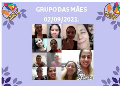
GRUPO DAS MÃES (02/09/2021)