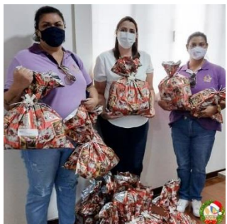
DOAÇÕES DE PRESENTES REALIZADO PELA AFESP-ASSOCIAÇÃO DOS FUNCIONÁRIOS PÚBLICOS DO ESTADO DE SÃO PAULO (22/12)