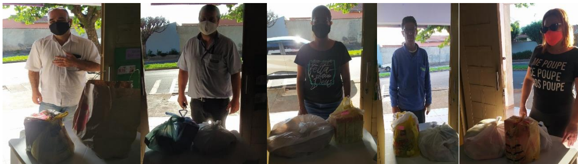
DOAÇÕES DE VERDURAS PARA AS FAMÍLIAS DO PROJETO VITÓRIA