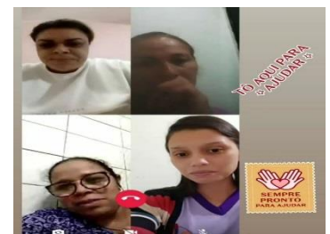
GRUPO DAS MÃES 17/06/2021