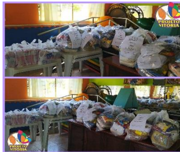
DOAÇÕES DE CESTAS BÁSICAS-FUNDO SOCIAL