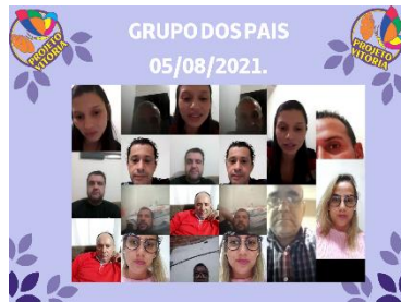
GRUPO DOS PAIS