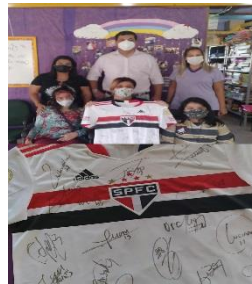
DOAÇÃO DE UMA CAMISETA OFICIAL DO SÃO PAULO FUTEBOL CLUBE