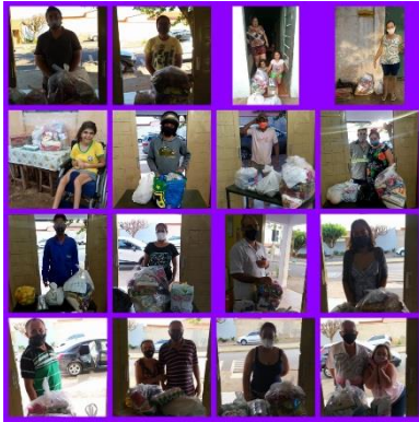
DOAÇÃO DE ALIMENTOS PARA AS FAMÍLIAS ATENDIDAS NO PROJETO VITÓRIA