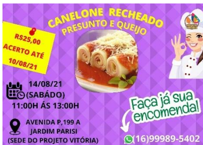
CAMPANHA DA MASSA