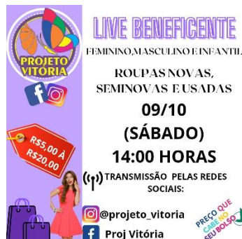
LIVE BENEFICENTE ROUPAS MASCULINAS, FEMININAS E INFANTIS