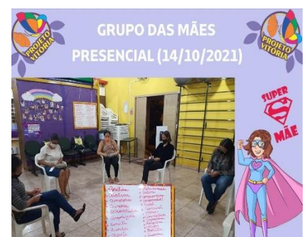
GRUPO DAS MÃES PRESENCIAL (14/10/21)