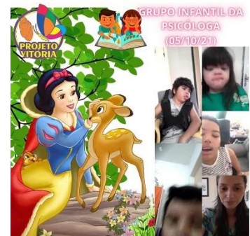
GRUPO INFANTIL DA PSICÓLOGA (05/10/2021)