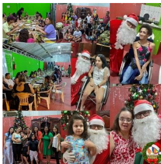
CONFRATERNIZAÇÃO FORNECIDA PELA ESTÂNCIA DA PIZZA (20/12)