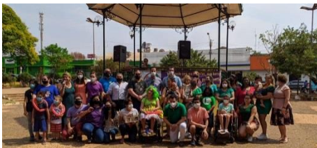
EVENTO EM COMEMORAÇÃO AO SETEMBRO VERDE REALIZADO NA PRAÇA MÁRIO FURTADO