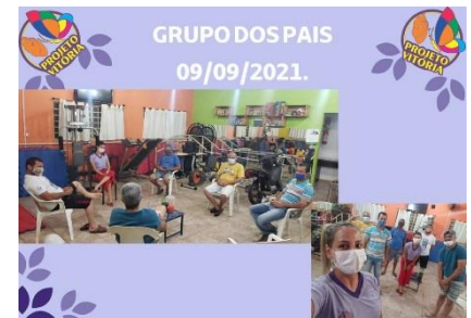
GRUPO DOS PAIS (09/09/2021)