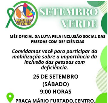
EVENTO EM COMEMORAÇÃO AO SETEMBRO VERDE