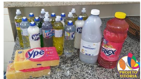
DOAÇÕES DE PRODUTOS DE LIMPEZA