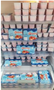
DOAÇÕES DE IORGUTES PARA AS CRIANÇAS ASSISTIDAS NO PROJETO