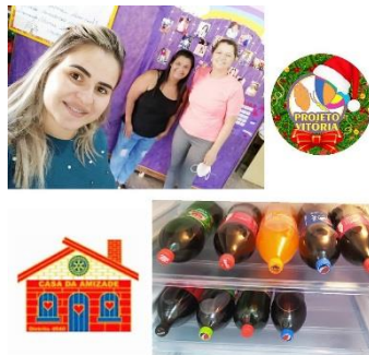
ENTREGA DE REFRIGERANTES REALIZADA PELA CASA DA AMIZADE DE ORLÂNDIA (21/12)