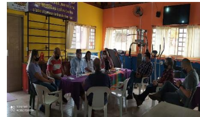
REUNIÃO COM O PREFEITO A RESPEITO DE PLANEJAMENTO