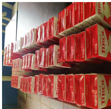
DOAÇÕES DE LEITE