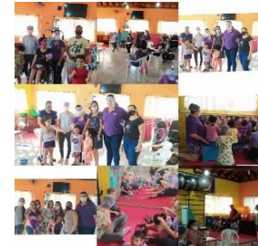
RETORNO AS ATIVIDADES PRESENCIAIS