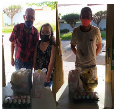
DOAÇÕES DE VERDURAS, OVOS E LEITE