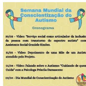
SEMANA DA CONSCIENTIZAÇÃO DO AUTISMO