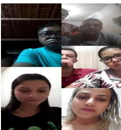
GRUPO DO CASAL