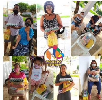
DOAÇÕES DE ALIMENTOS PARA AS FAMÍLIAS (29/10/21)