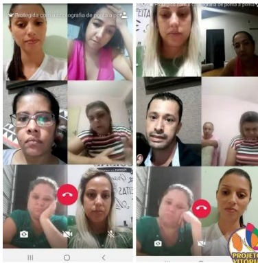
GRUPO DA FAMÍLIA