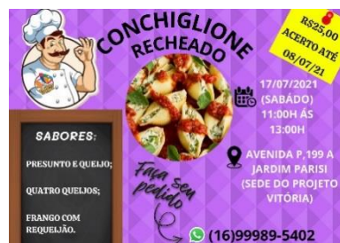
CAMPANHA DO MÊS