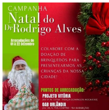
CAMPANHA DE NATAL PARA ARRECADÇÃO DE BRINQUEDOS PARA AS CRIANÇAS DO NOSSO MUNICÍPIO