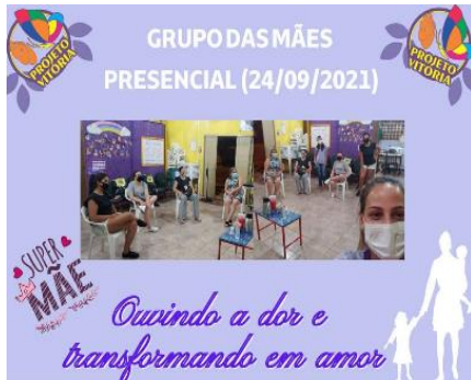
GRUPO DAS MÃES PRESENCIAL (24/09/2021)