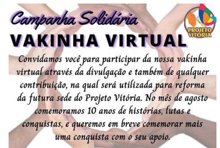
CAMPANHA DA VAKINHA VIRTUAL PARA REFORMA DA SEDE DO PROJETO