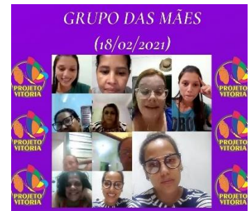
GRUPO DAS MÃES