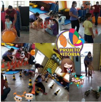
GRUPO EQUIPE MULTI 01/10