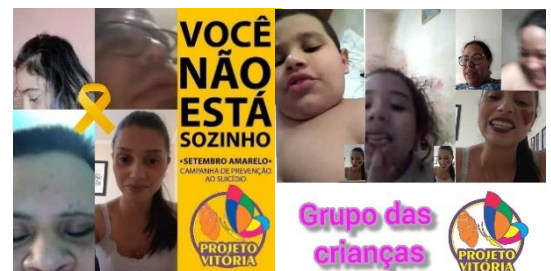
GRUPO DA PSICÓLOGA ONLINE COM OS ATENDENTES 21/09