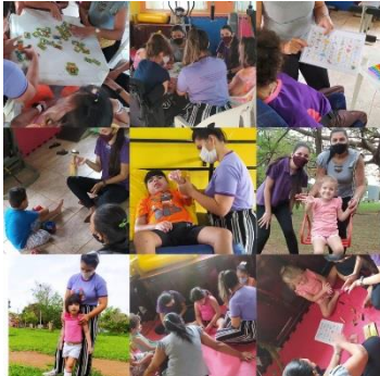
GRUPO EQUIPE MULTI 15/10/21