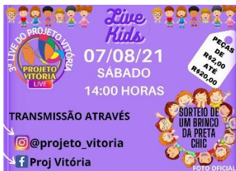
LIVE BAZAR DE ROUPAS