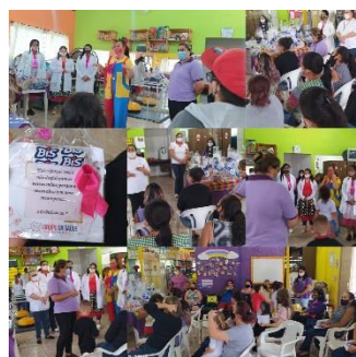
CELEBRAÇÃO DO DIA DAS CRIANÇAS (07/10/2021)