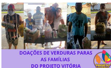
REPASSO DE DOAÇÕES DE VERDURAS PARA AS FAMÍLIAS