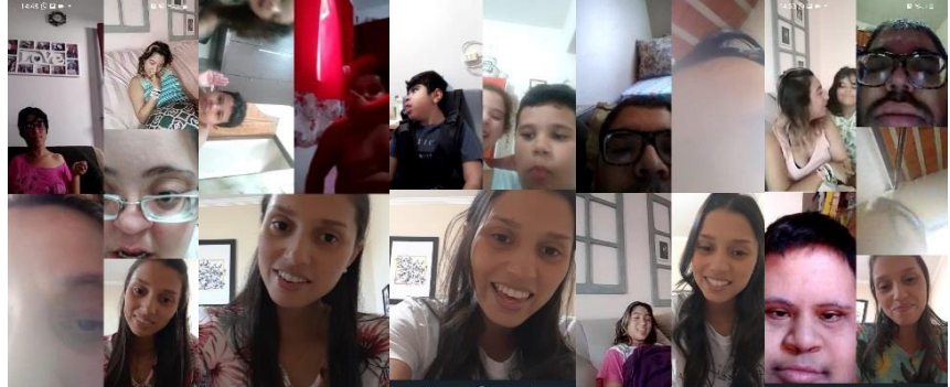
GRUPO DA PSICÓLOGA COM OS ADOLESCENTES E CRIANÇAS REALIZADO AS TERÇAS-FEIRAS