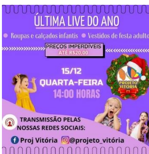
LIVE BENEFICIENTE PARA ARRECADAR FUNDOS PARA O PROJETO