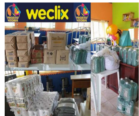
DOAÇÕES DE PRODUTOS E HIGIENE