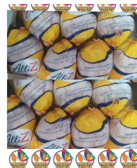
DOAÇÕES DE 20 FRANGOS CONGELADOS REALIZADO PELO CLOSET INTELIGENTE, ATRAVÉS DA DEISE PIAI (09/12)