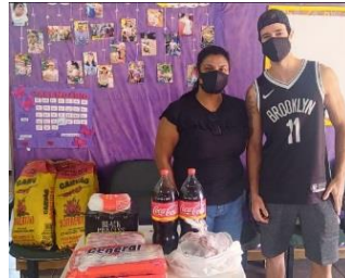
GANHADOR DA RIFA: KIT CHURRASCO