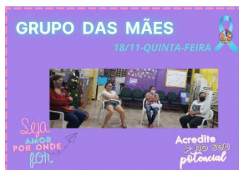
GRUPO DAS MÃES (18/11)