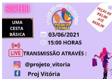
LIVE BENEFICENTE EM PROL DO PROJETO.