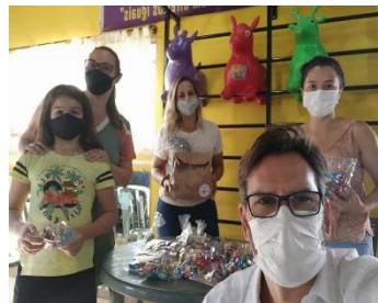
DOAÇÕES PARA A PÁSCOA