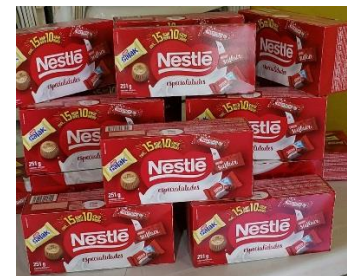
DOAÇÕES PARA A PÁSCOA