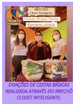
DOAÇÕES DE CESTAS BÁSICAS