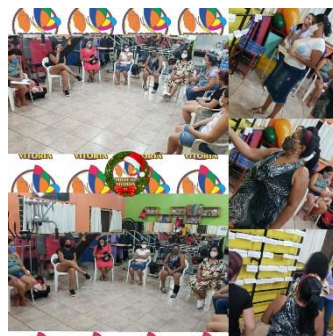
GRUPO DAS MÃES REALIZADO PELA PSICÓLOGA E ASSISTENTE SOCIAL (09/12)