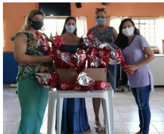
DOAÇÕES PARA A PÁSCOA