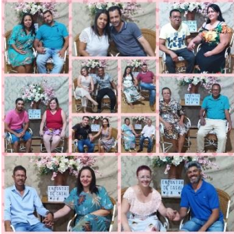
ENCONTRO DE CASAIS 2021 (25/11/21)