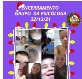
ENCERRAMENTO DO GRUPO DA PSICÓLOGA COM AS CRIANÇAS E ADOLESCENTES (22/12)