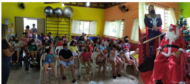
FESTINHA DE NATAL E ENCERRAMENTO DAS ATIVIDADES ANUAIS (23/12)