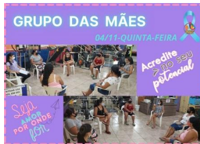
GRUPO DAS MÃES (04/11)