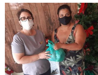
DOAÇÕES DE INGREDIENTES PARA O JANTAR DO ENCONTRO DE CASAL, REALIZADA PELO SUPERMERCADO ECONÔMICO 19/11/21