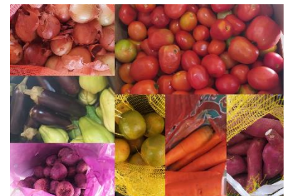
DOAÇÕES DE VERDURAS