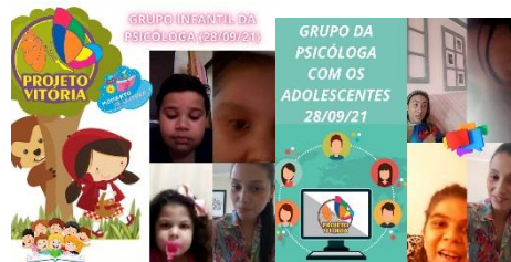
GRUPO DA PSICÓLOGA ONLINE COM OS ATENDENTES 28/09