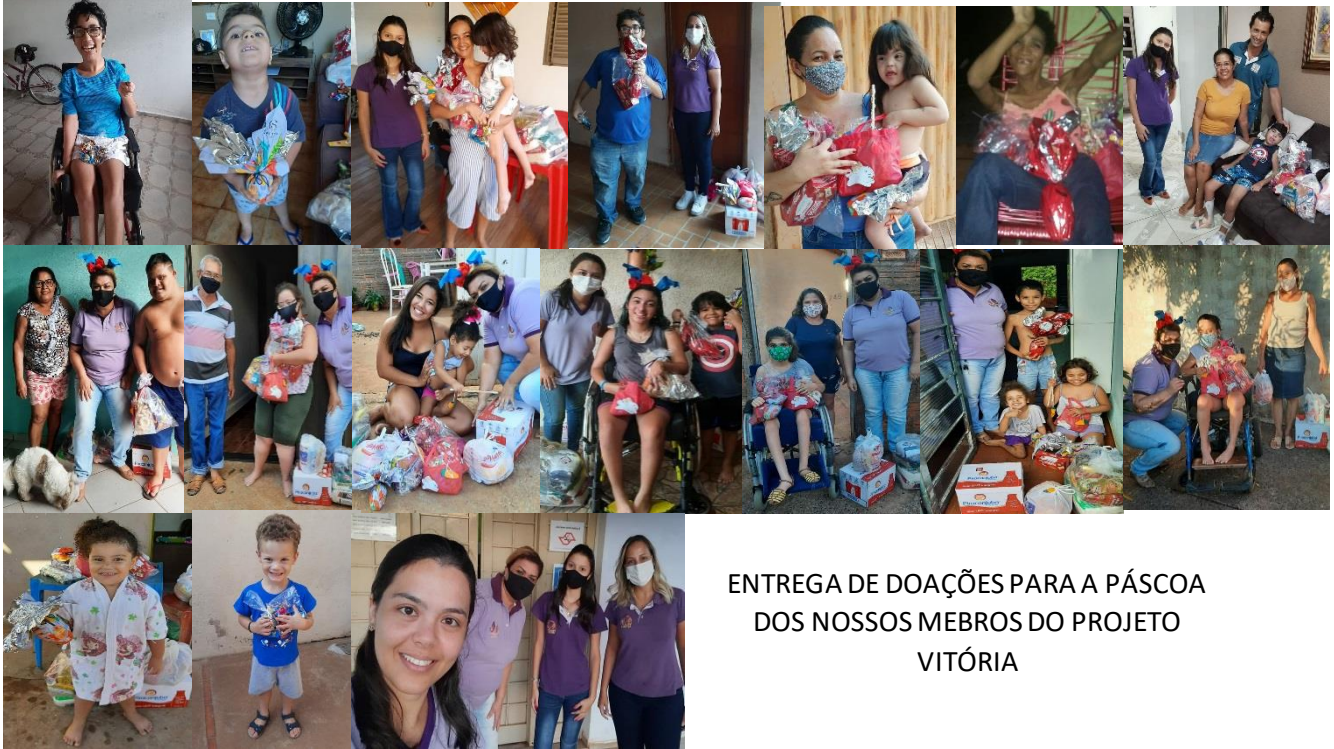
ENTREGA DE DOAÇÕES PARA A PÁScoa DOS NOSSOS MEMBROS DO PROJETO VITÓRIA