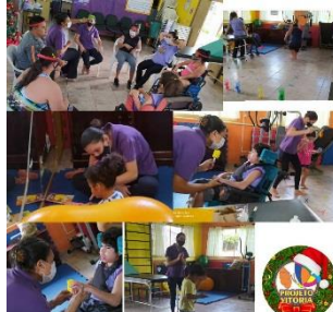
TERAPIA COM A EQUIPE MULTIDISCIPLINAR (03/12)