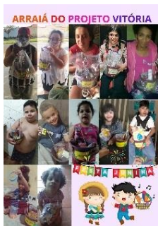
FESTA JULINA COM OS USUÁRIOS