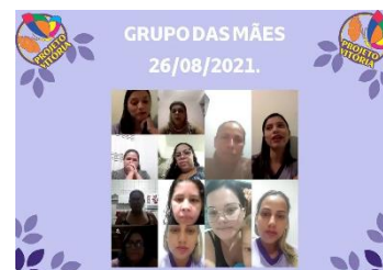
GRUPO DAS MÃES