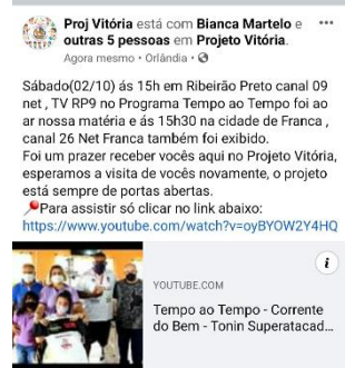
DOAÇÕES DE CESTAS BÁSICAS ATRAVÉS DO PARALÍMPICO THIAGO PAULINO, ARRECADADAS PELO PROGRAMA TEMPO AO TEMPO