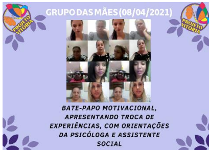
GRUPO DAS MÃES