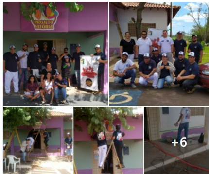
AÇÃO SOCIAL MBPM-PINTORES DE RIBEIRÃO PRETO E REGIÃO PARA PINTURA DO PROJETO VITÓRIA (19/12)