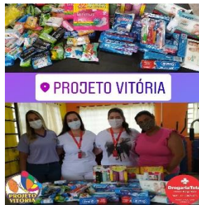
DOAÇÕES DE PRODUTOS DE HIGIENE FEITO PELA DROGASERV ATRAVÉS DA CAMPANHA DE DIA DAS CRIANÇAS (03/11)