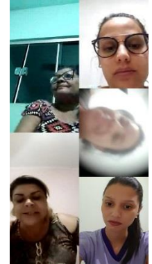
GRUPO DAS MÃES