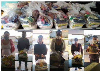
DOAÇÕES DE CESTAS BÁSICAS PARA AS FAMÍLIAS DO PROJETO VITÓRIA