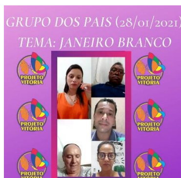
GRUPO DOS PAIS