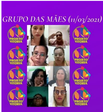
GRUPO DAS MÃES