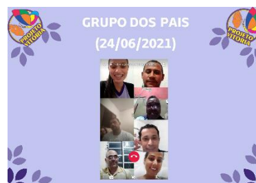
GRUPO DOS PAIS 24/06/2021