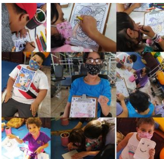
GRUPO EQUIPE MULTI 29/10/21