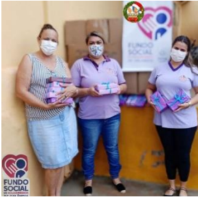
DOAÇÕES DE CESTAS BÁSICAS E CHOCOLATES REALIZADA PELO FUNDO SOCIAL DE ORLÂNDIA