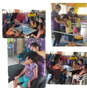
TERAPIA COM OS ATENDIDOS 17/09/2021