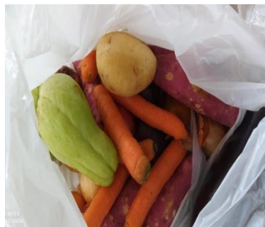
DOAÇÃO DE VERDURAS