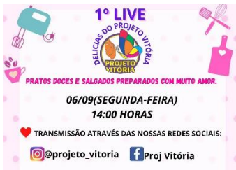
LIVE DELÍCIAS DO PROJ. (06/09)