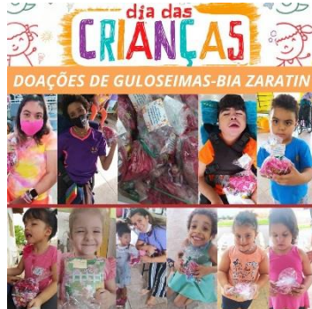
DOAÇÕES DE GULOSEIMAS PARA O DIA DAS CRIANÇAS (15/10/21)