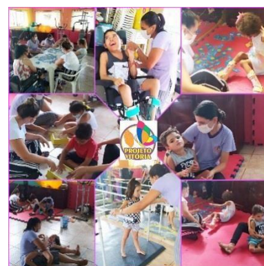
Terapias realizada pela equipe multidisciplinar