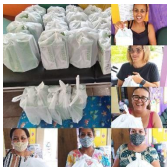
Doação de caixinhas de leite