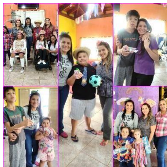
Terapia Caipira com a equipe multidisciplinar