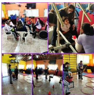
Terapias realizadas pela equipe multidisciplinar.