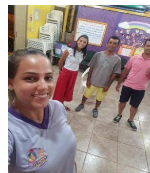
Grupo semanal realizado pela Assistente Social e Psicóloga