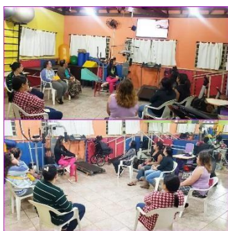
Grupo Semanal realizado pela Assistente social e pela Psicóloga