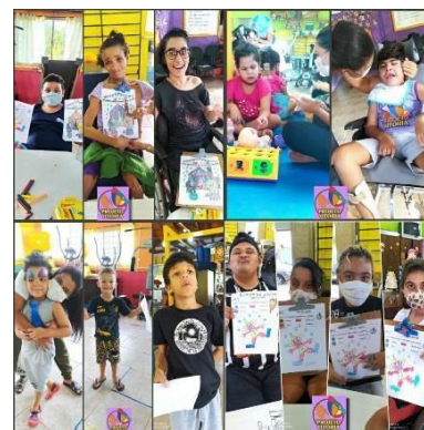
Terapias realizada pela equipe multidisciplinar