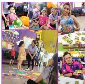
Terapia semanal com a equipe multidisciplinar