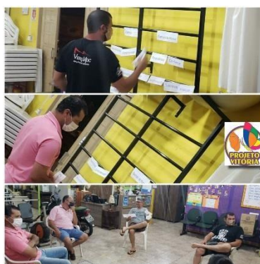
Grupo semanal realizado pela Assistente Social e Psicóloga