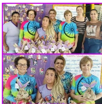
Doação de caixas de bombom para páscoa