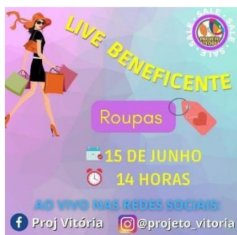
LIVE BENEFICENTE de roupas