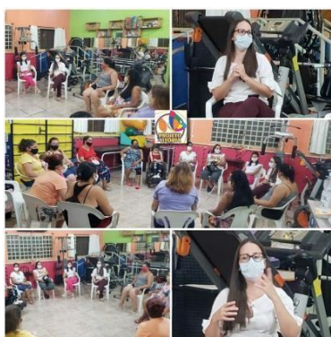
Grupo semanal realizado pela Assistente Social e Psicóloga (Tivemos a visita da Nutricionista especialista em Terapia Nutricional no TEA) 13/03/2022