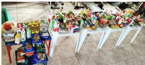
Doação de mais de 130kg de alimentos arrecadados em uma palestra aqui em Orlandia (30/06 - salão diprima)