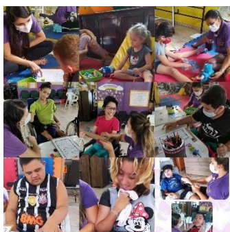
Terapia realizada pela equipe multidisciplinar