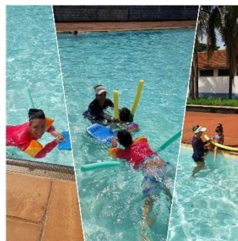
Natação realizada no Centro de Lazer