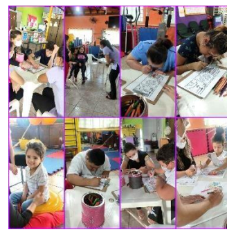
Terapias realizadas pela equipe multidisciplinar.