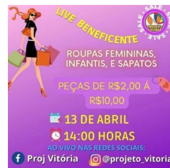
Live Beneficente de roupas