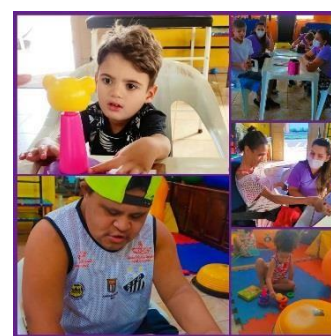
Terapia semanal com a equipe multidisciplinar