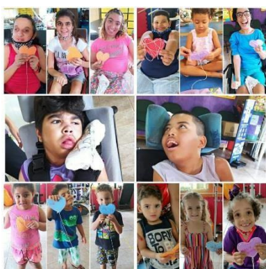
Terapias realizada pela equipe multidisciplinar