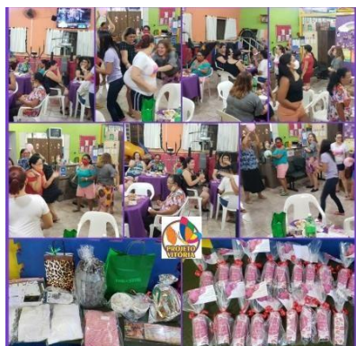
Grupo semanal realizado pela Assistente Social e Psicóloga 10/03/2022