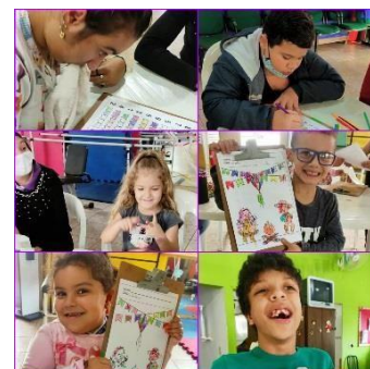
Terapia semanal com a equipe multidisciplinar